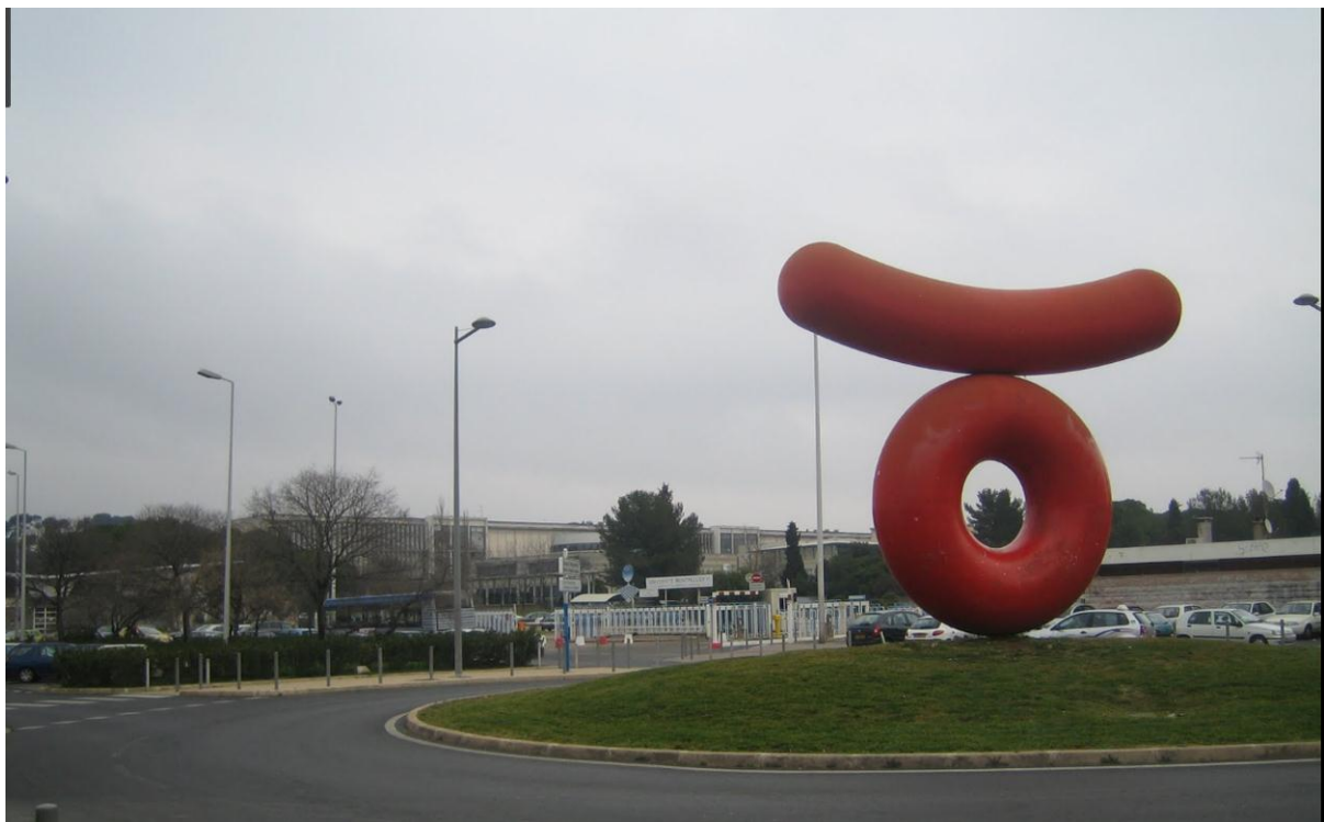
Vue de l'entrée principale